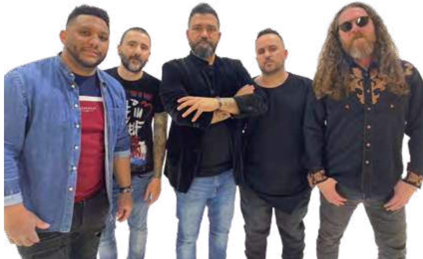
Sin Enchufe. Tributo a M-Clan